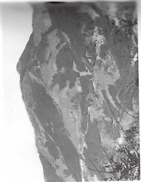
優美な山容が特徴

新新田峠から大霧山までは、関東ふれあいの道として整備されたコース。歩きやすい道だ。樹林帯の中を進み、階段になった急登を2カ所登れば、大霧山山頂に出る。山頂は北側の雑木