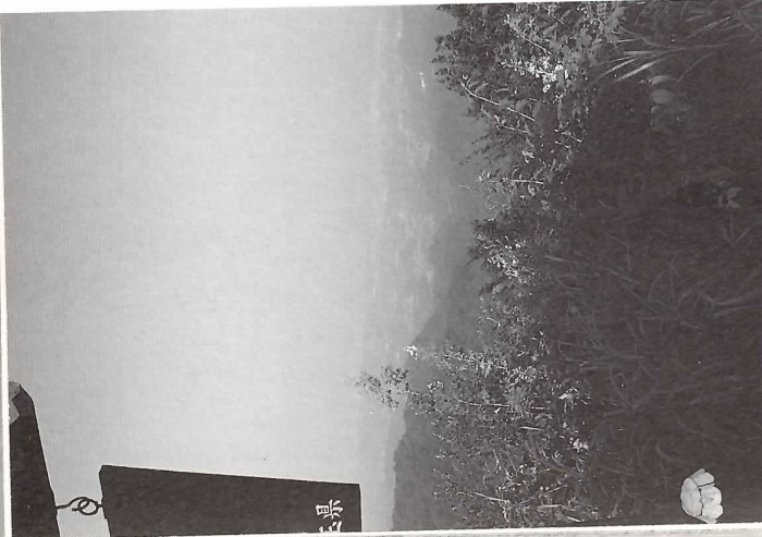
展望が楽しめる山頂。晴れた日は、上州の山々も見渡せる

が切れ、展望が開けている。西神山を真ん中にして左に秩父、右に上州の山並みが望める。 展望を楽しんだ後は下山。雑木林の中を下っていくと、左手